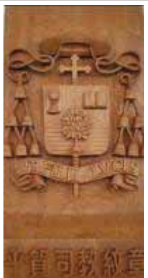
本彫で立体的に作られた平賀司教の紋章。カテドラル聖堂入り口に設置されている。