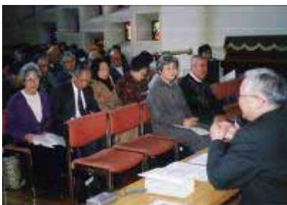
司教団社会司教委員会