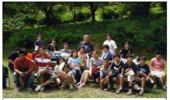
四ツ家・志家・上堂教会合同キャンプ