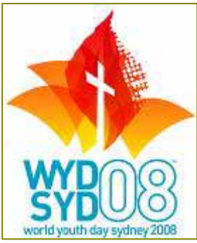
WYD 08 のロゴマーク

今年7月にオーストラリアのシドニーで世界青年大会(WYD)が開かれます。今まで、カナダのトロントやドイツのケルンでの大会に参加された青年たちは、世界中の若者達と共に本当に良い信仰の体験をしてきました。そして日本に帰ってからお互いに連絡を取り合いながら、青年ネットワークを立ち上げたりして交わりを強めて活動をしていま