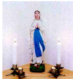
ルルドのマリア様