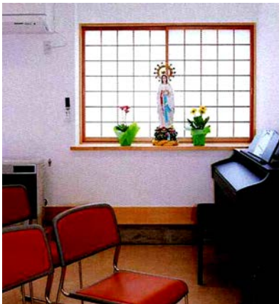
ファチマのマリア様

この聖堂には、2体のマリア像が祭壇を中心に、左右に置かれています。1体は、ルルドのマリア像です。この教会の歴史とともに60年の間、修復を重ね、大切にされているもの。そしてもう1体は、ファティマのマリア像。フィリピンから持ち帰ってきた大切なマリア像です。この2体のマリア像は、共に1つの共同体をつくるシンボルとして安置されているものです。