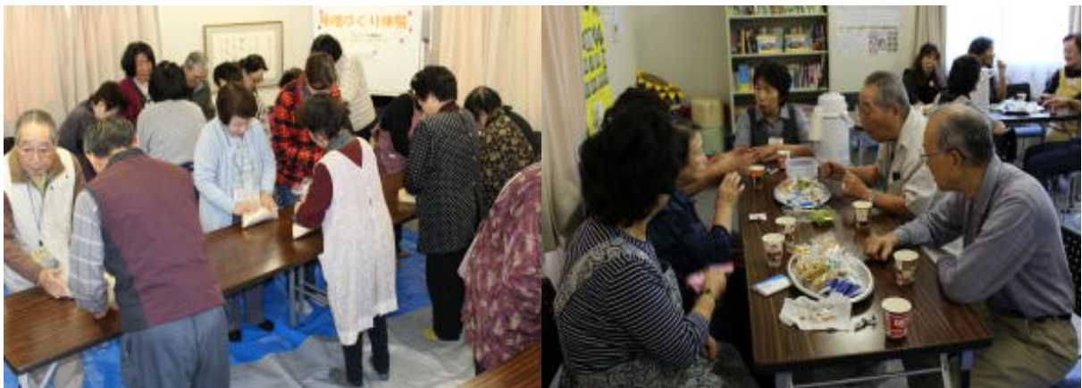
味噌づくりとその後のお茶会・分かち合いの様子

○集会所にいる間は歌をうたい、おしゃべりして楽しいが、家に帰ると独りになり、先が不安で夜眠れないという方もいた。