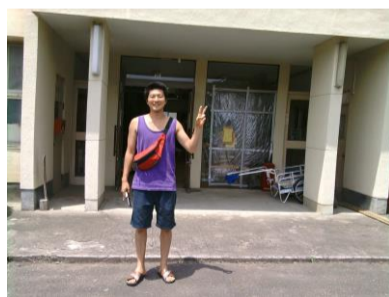
米川新ベースで、イエーイ！

3・11から1年が過ぎた今、各ベースの活動は脈々と続いています。しかしながら、どのベースでもボランティアが少ないのが現状です。更に福島ではいわき、原町において支援活動が展開されていますが、放射能の問題は福島県全域に拡がり、県内在住の方々を苦しめています。さまざまな事柄が複雑に絡み合い、支援の方法も簡単ではありませんが、何時までも手を拱いて居る訳にもいきません。小さな歩みであっても確実に福島に寄り添う支援活動を続けたいと考えております。これからも皆さま方のボランティア派遣をはじめとした支援活動へのご理解とご協力を宜しくお願い致します。