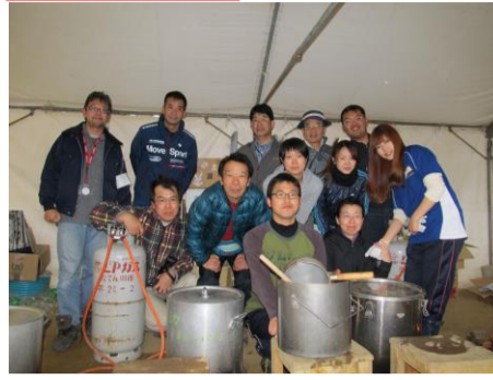
門中のお湯だしチーム！

昨年3月23日、石巻市の調査として初めて現地入りした時の事を鮮明に覚えています。無力感・絶望感を感じながらも、まずは出来る事をと石巻教会での活動を開始しました。現地の方の協力を得て