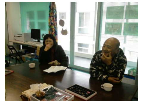
サボセンで暫し休息！ 筆者右

瓦礫の撤去、ヘドロをかきだし。洗浄。壁を張りなおし、冷蔵庫を入れ替え……商品を少しずつ増やして。ようやく店らしくなり、のんびり出来るリビングが戻りました。しかし、この地区は震災前の三割程度しか住人がいないので、お客さんがとても少ない状況です。