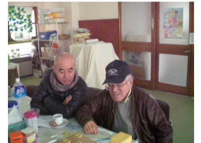
ふいりあで被災者に耳を傾ける筆者 左

大震災とその被害は、釜石の街の方々の生活を根底から変えてしまうほどのものでした。『こんなはずじゃなかった』と何人の方から聞いたことか……。望んでいた現実と違う……。考えていた将来とは違う、どうしてあの人が先に死んでしまうのか……等の内面の痛みは大きな傷となって街の方々に刻まれているようです。この叫び・この痛み・この不合理の基でも生きる力を失わずに、この被災地で生きるためには、いかほどの力が必要なのかと痛感します。しかし、この被災地に住む方々から、この現実でも人として生きる力が如何なるモノであるかきっと私たちに教えてくれる日が来るであろうと信じたいと思います。（宇根 節）