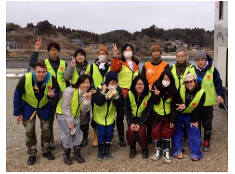
志津川にて千葉隊集合！オレンジビブスが筆者！

去年の6月に初めて米川ベースに来た時は米川教会の司祭館がベースでした。とても小さなベースでしたが狭い食堂の中で10人くらいでの夕食はアットホームで楽しかったです。昨年7月、夏休み前に現在のベース、