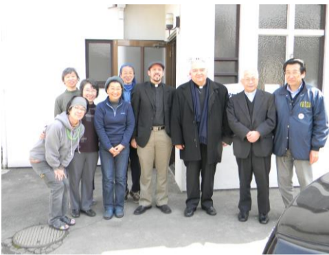
前教皇大志塩釜ベース訪問。筆者右端

全世界から750余名の皆様が東北のボランティアのために塩釜教会に御参集頂き、深く地元根ざした活動をしていただいた事に心より感謝申し上げます。次第です。