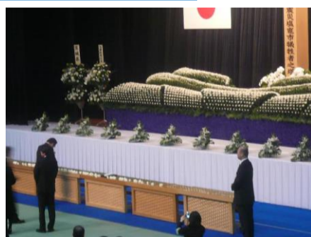
塩釜市の震災犠牲者慰霊祭

塩釜の浦戸諸島、桂島の前浜清掃ボランティアに参加したのは、東日本大震災後3ヶ月を過ぎた7月でした。船を降り浜に向かう途中、目にする景色は多くの被災家屋が壊れたまま手付かずの状態にあり、海岸の松は津波被害により茶褐色に変色していました。浜辺に打ち上げられる瓦礫は波に乗って次々と押し寄せ、片付けは根気のいる作業でした。最近同じ場所を訪ねる機会がありました。被災家屋は片付いていましたが、跡地には泥だらけになった布団や生活用品が山のように積み重なっていて、一年の時間が過ぎても、そこで生活を営んでいた人々の深い悲しみと痛みが残っているように感じました。