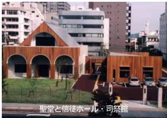
聖堂と信徒ホール・司祭館

構造は、鉄筋コンクリートながら、木をつまくり取り入れ、教会正面の市立美術館との調和をはかり、聖堂内部は音響はもろろんのこと、落ち着いてお祈り、黙想が