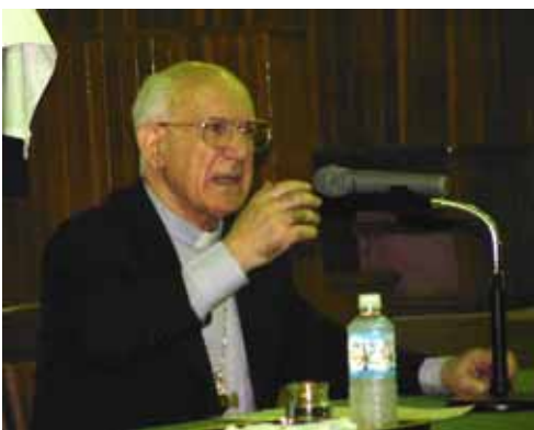
熱心に語るピタウ大司教