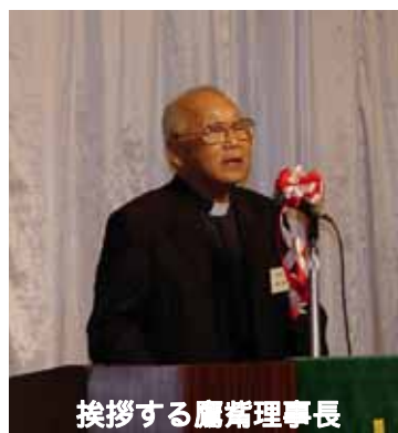
挨拶する鷹鷲理事長

光ヶ丘スベルマン病院は、終戦後、カトリック北仙台教会の主任司祭ピエール・ピソネット神父(ドミニコ会)が結核に悩む貧しい人たちのために無料で治療する病院を建てようと当時仙台に駐留していた米軍およびその家族から、寄付を集め、来日中のスベルマン枢機卿