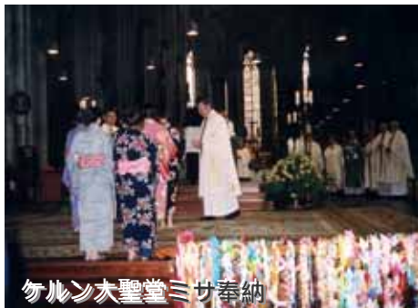
ケルン大聖堂ミサ奉納